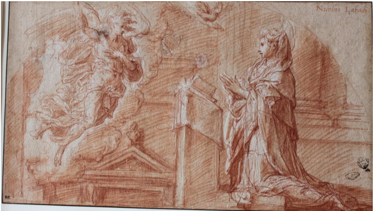
Nicolo Dell'Abate, Annonciation , vers 1553, sanguine, rehauts de blanc, département des Arts graphiques, Musée du Louvre