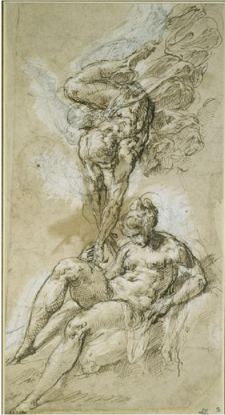
Nicolo Dell'Abate, Zéphyr et Psyché , vers 1557, plume et encre brune, rehauts de blanc, Ashmolean Museum.