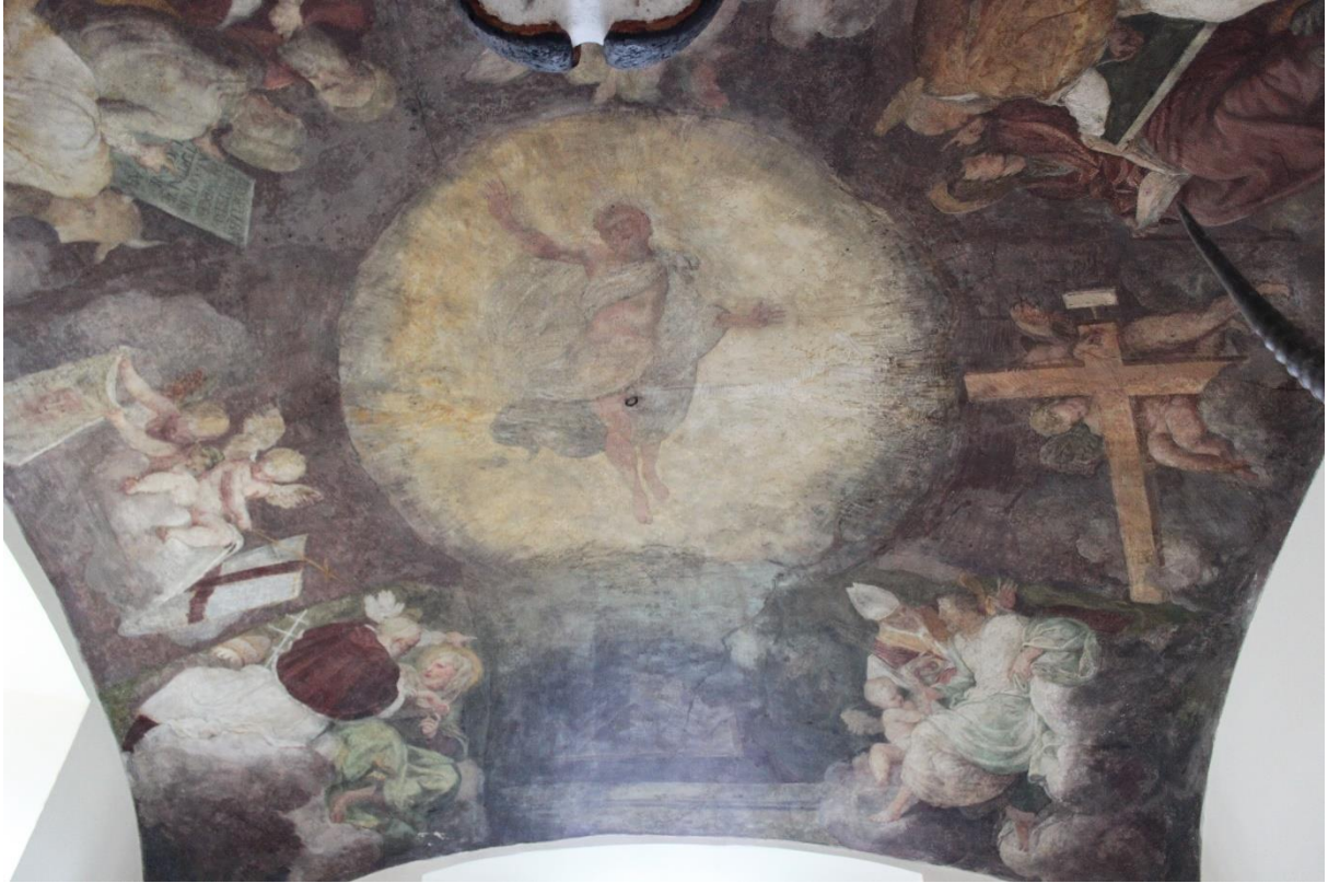
Nicolo Dell'Abate, Résurrection du Christ , vers 1553, fresque, ancienne chapelle de Cosme Clause, château de Fleury-en-Bière