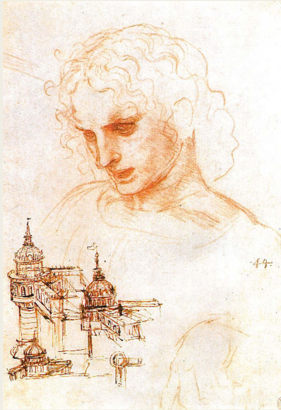
Leonardo da Vinci, Schizzi architettonici e studio per la testa di San Giacomo , 1495 circa, RL 12552, Castello di Windsor, The Royal Library

mercoledì 27 settembre 2023 alle 17:30 Accademia Nazionale di San Luca, Roma